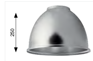
150030.00243 Ø 350