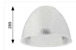
PMMA 150020.00241 PC 150020.00242 Ø 400